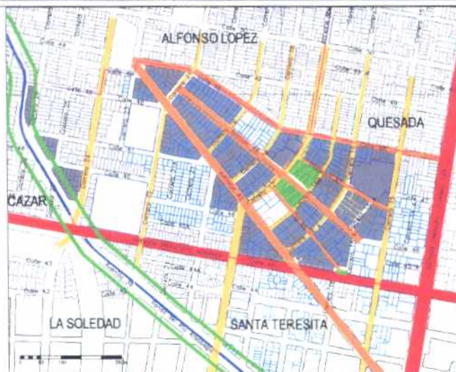
Inmuebles de Interés Cultural - MORFOLOGÍA EN PLANTA