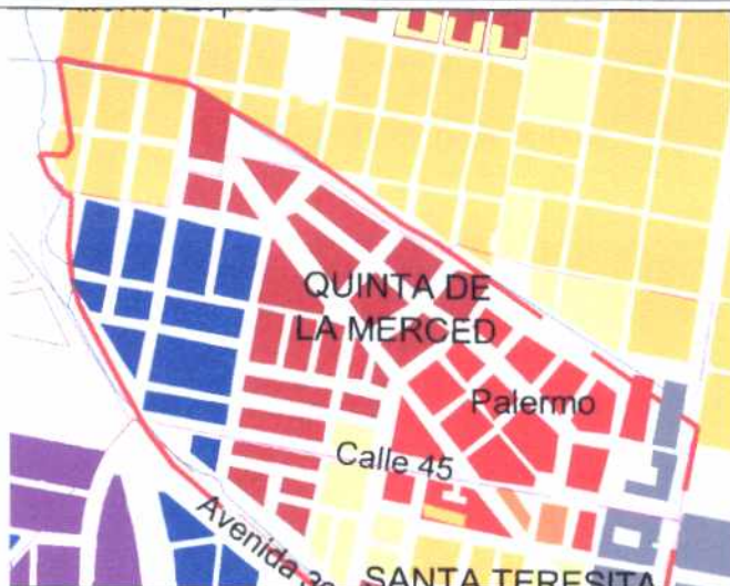
CRECIMIENTO HISTÓRICO - CRONOLOGÍA