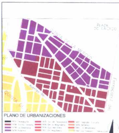
PLANO DE URBANIZACIONES

El barrio Palermo el trazado a partir de diagonales domina su estructura general. Las vías confluyen a un punto (Escuela Distrital, que hoy no hace parte del barrio), configurando un trazado que hace pensar en varias de las propuestas del urbanista Karl Brunner.